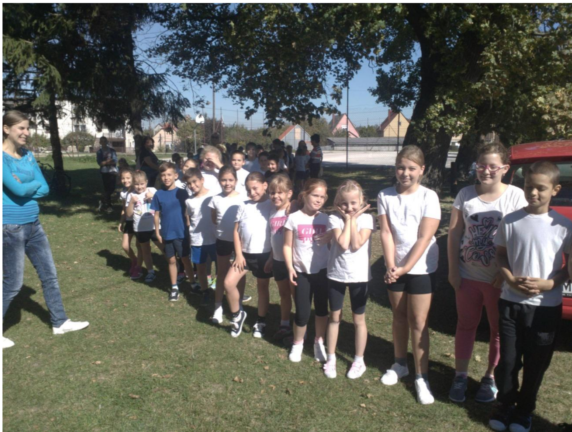
A legkisebbek is startra várva (I. kcs)