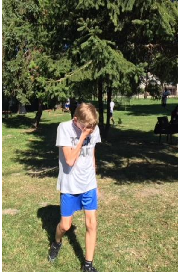
Idén Bence volt jobb