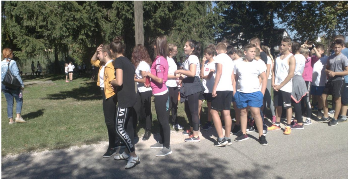
Érkeznek a legnagyobbak (IV. kcs.)

A tanulók a versenyre óránként, korcsoportonként jöttek, a futóversenyre beöltözve. A nagy forgalmú 81. számú főutat is átszelve az osztályfőnökök mai legfontosabb feladata volt a gyerekeket biztonságban eljuttatni a rajthelyhez. Először az 5-6. osztályosok (3. korcsoport), majd a 7-8. osztályosok (IV. korcsoport), a 3-4. osztályosok (II. korcsoport) végül a legkisebbek, az 1-2. osztály (I. korcsoport) tanulói érkeztek meg.