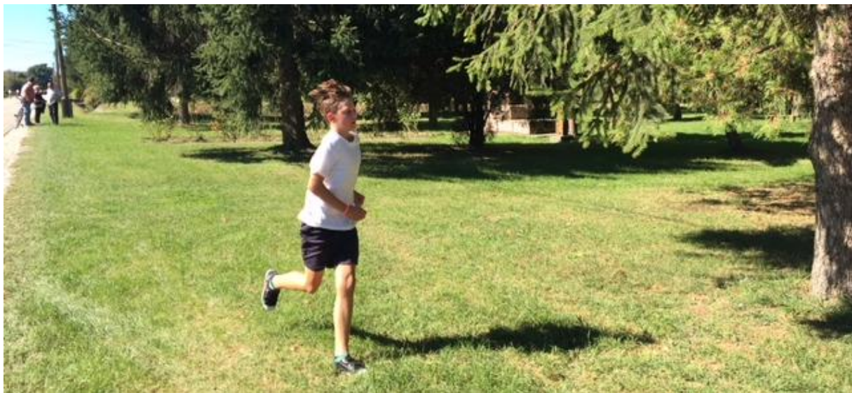
A bronz is csillog Barninak