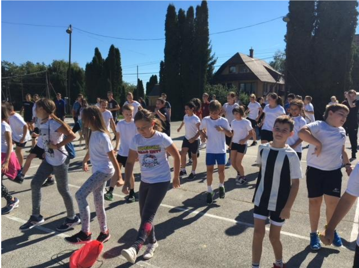
A III. korcsoport bemelegítése