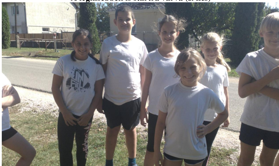
Mosolyogva beérkezés után (II. kcs)