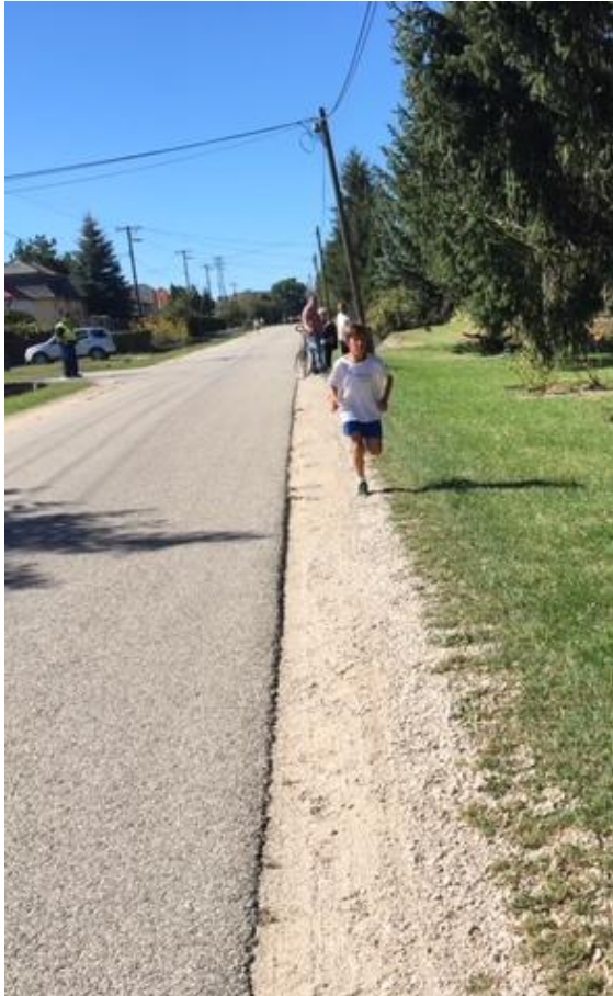
Hiába Dani nagy hajrája